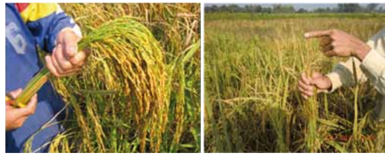
ການຕົກກ້າ

ການເກັບຮວງ: ໃຫ້ເກັບເອົາຮວງແມ່ ໂດຍເລືອກເອົາ ຮວງຈາກຕົ້ນ ທີ່ມີໃບວີສູງທີ່ສຸດ ພາຍໃນສຸມ, ເກັບເອົາ 1 ຮວງຕໍ່ 1 ສຸມ ຈາກນັ້ນໃຫ້ແກະກາບໃບວີອອກ, ໃນ 100 ຮວງໃດໃຫ້ເຮັດເປັນ 1 ມັດ ແລ້ວຕາກແດດ 7-10 ແດດ ແລ້ວເກັບຮັກສາໄວ້ເພື່ອລໍຖ້າຕົກກ້າ, ໃຫ້ເກັບປະມານ 500 ຮວງເປັນຢ່າງຕໍ່າ.