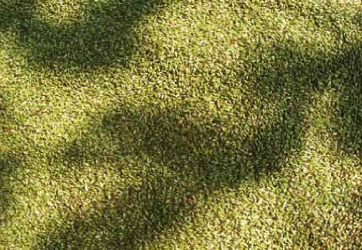
ການຕາກເມັດພັນ

ເມັດພັນທີ່ໄດ້ໃຫ້ນໍ້າໄປຕາກໃນບ່ອນຮີມ 2 ວັນ ເພື່ອລົດຄວາມຊຸ່ມ ແລ້ວນໍາອອກມາຕາກແດດອີກ 1 ວັນ ການຕາກເມັດ ຄວນເຂ່ຍປີ້ນກັບເມັດເລື້ອຍ ໆ ເພື່ອໃຫ້ເມັດແຫ້ງຢ່າງສະໝໍ່າສະເໝີ ຫລັງຈາກນັ້ນ ທໍາຄວາມສະອາດໂດຍການໃຊ້ກະດິ່ງຝັດສິ່ງເຈືອປົນອອກໄປ.