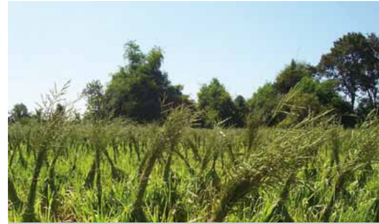
ມັດຊໍ່ດອກເພື່ອກະກຽມເກັບເມັດພັນ

ເມື່ອຫຍ້າອອກດອກ ຄວນກະກຽມການເກັບເມັດ ໂດຍໃຊ້ ເຊືອກຟາງມັດຊໍ່ດອກເຂົ້າຫາກັນເພື່ອສະດວກໃນການເກັບ