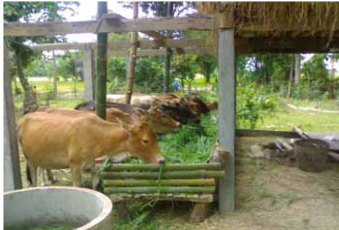
ການຕັດຫຍ້າລ້ຽງງົວ

ເລີ່ມຕັດໃຫ້ສັດກິນເທື່ອທຳອິດເມື່ອຫຍ້າມີອາຍຸ ປະມານ 45-50 ວັນ ຫລັງຈາກປູກ ແລະ ຕັດເທື່ອຕໍ່ໄປທຸກໆ 35-40 ວັນ ໂດຍຕັດສູງຈາກຫ້າດິນ ປະມານ 10-12 ຊມ. ແລ້ວໃສ່ບຸ່ຍຢູ່ເຣຍ (46-0-0) ອັດຕາ 10 ກິໂລ/ໄຮ ຫລັງຈາກຕັດທຸກຄັ້ງ. ຖ້າປູກໃນ ພື້ນທີ່ ທີ່ອາໄສນ້ຳຝົນຢ່າງດຽວຈະໃຫ້ຜົນຜະລິດນ້ຳໜັກຫຍ້າ ສິດ 6-8 ໂຕນ/ໄຮ/ປີ.