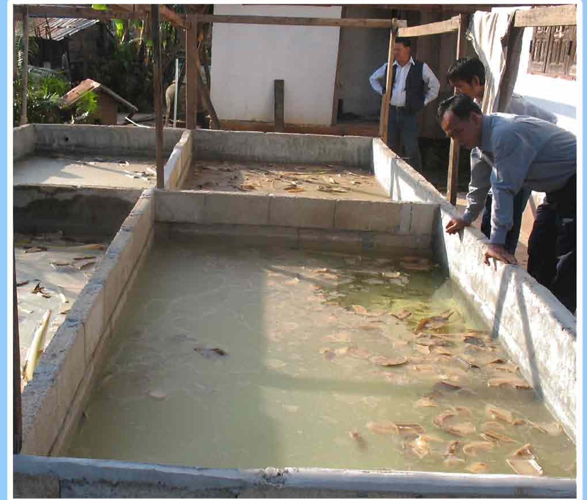
3. ການລ້າງນ້ຳປຸນຊີເມັນ