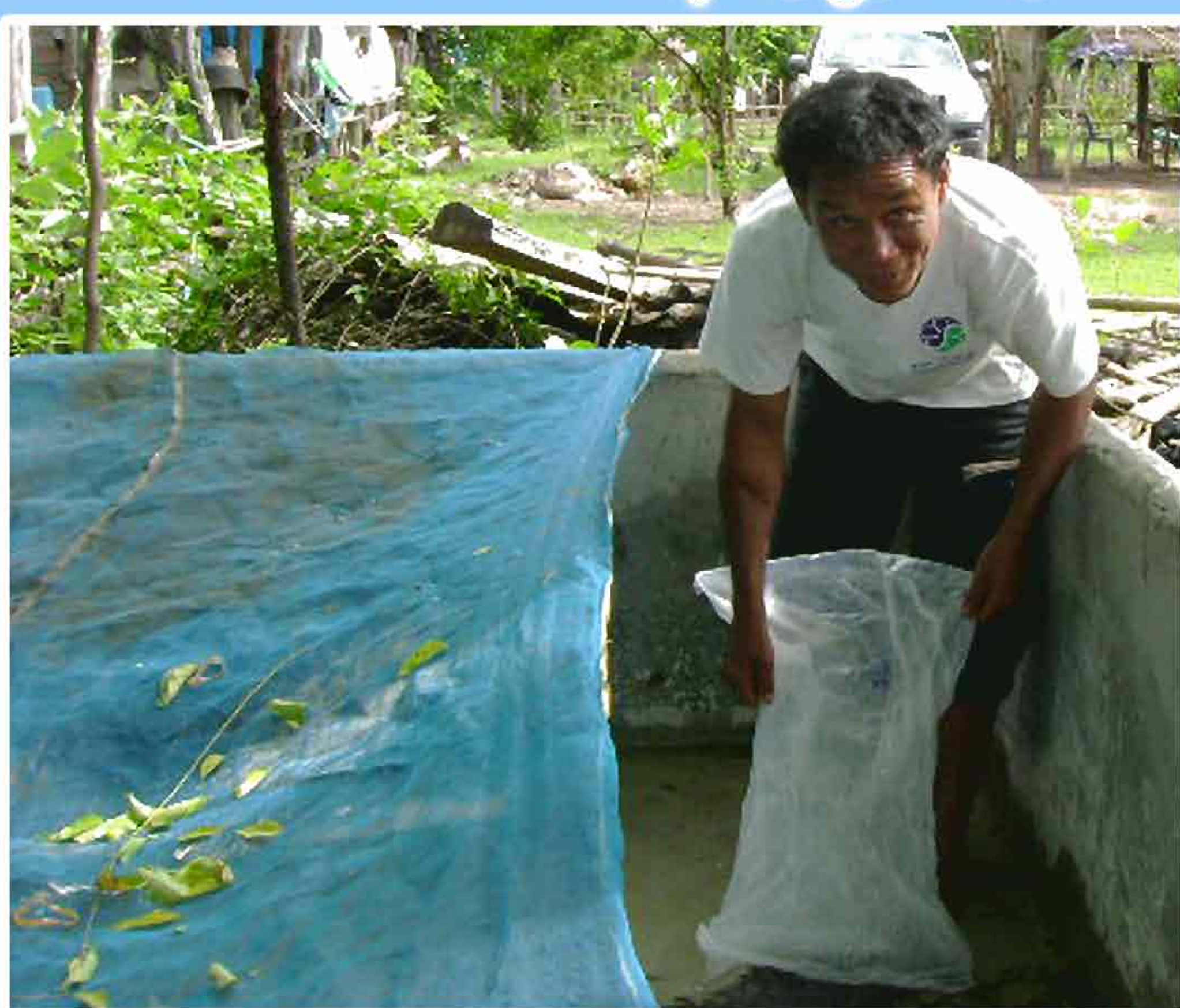
7. ການປ່ອຍແນວພັນປາດູກລົງລ້ຽງໃນອ່າງ