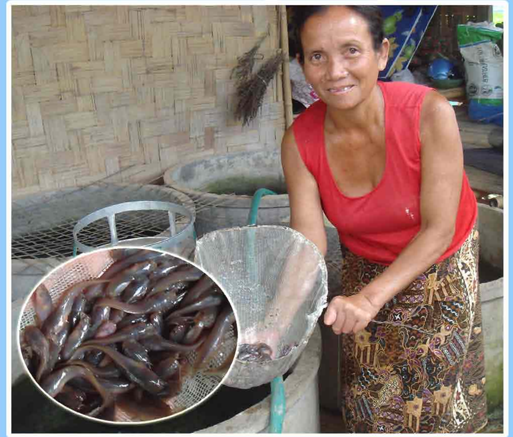
6. ແນວພັນປາດູກທີ່ນຳມາລ້ຽງ