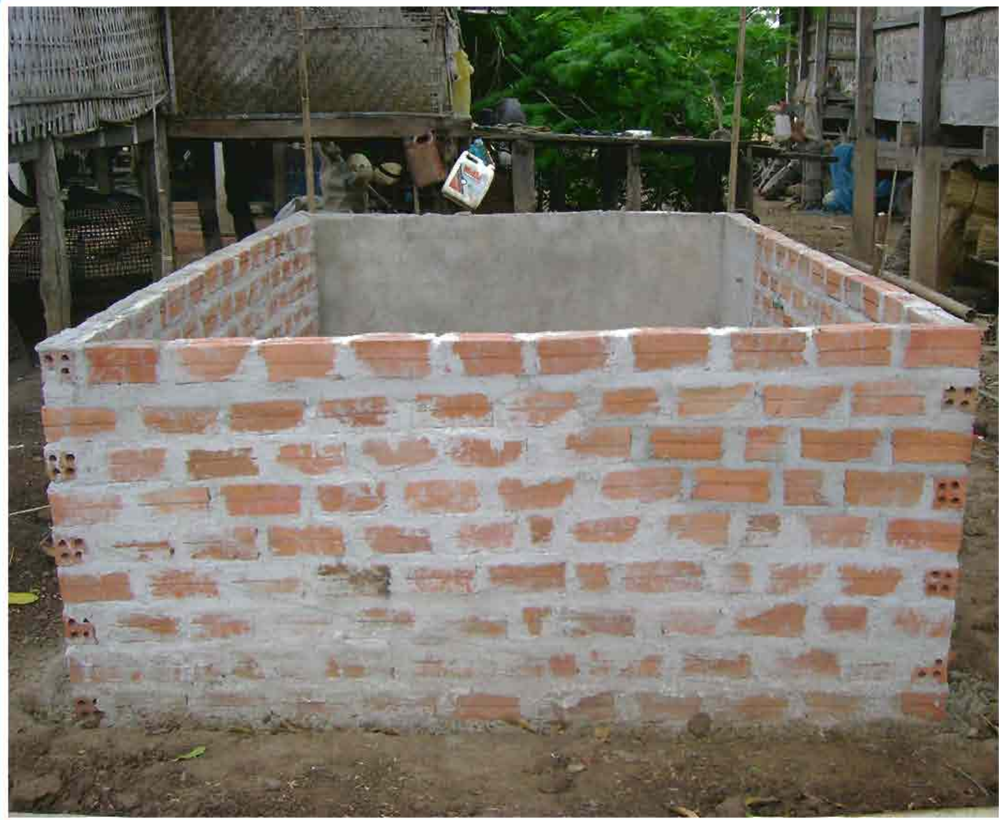
1. ການກໍ່ສ້າງອ່າງຊີເມັນ