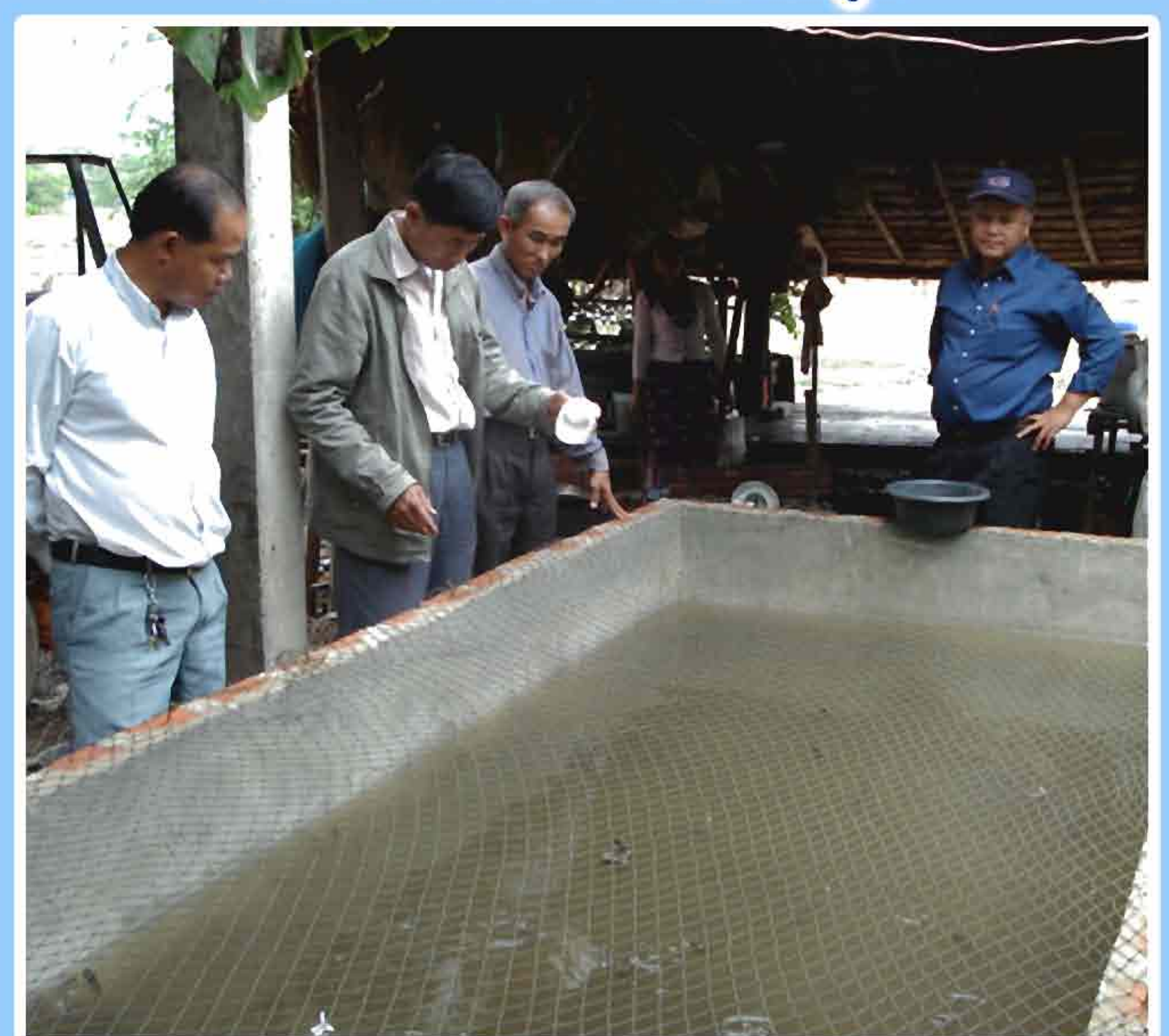
9. ການໃຫ້ອາຫານສຳເລັດຮູບ