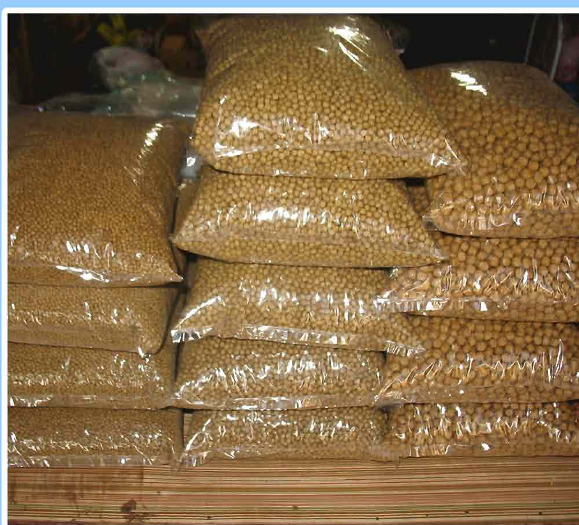
8. ອາຫານສຳເລັດຮູບທີ່ໃຊ້ລ້ຽງປາ