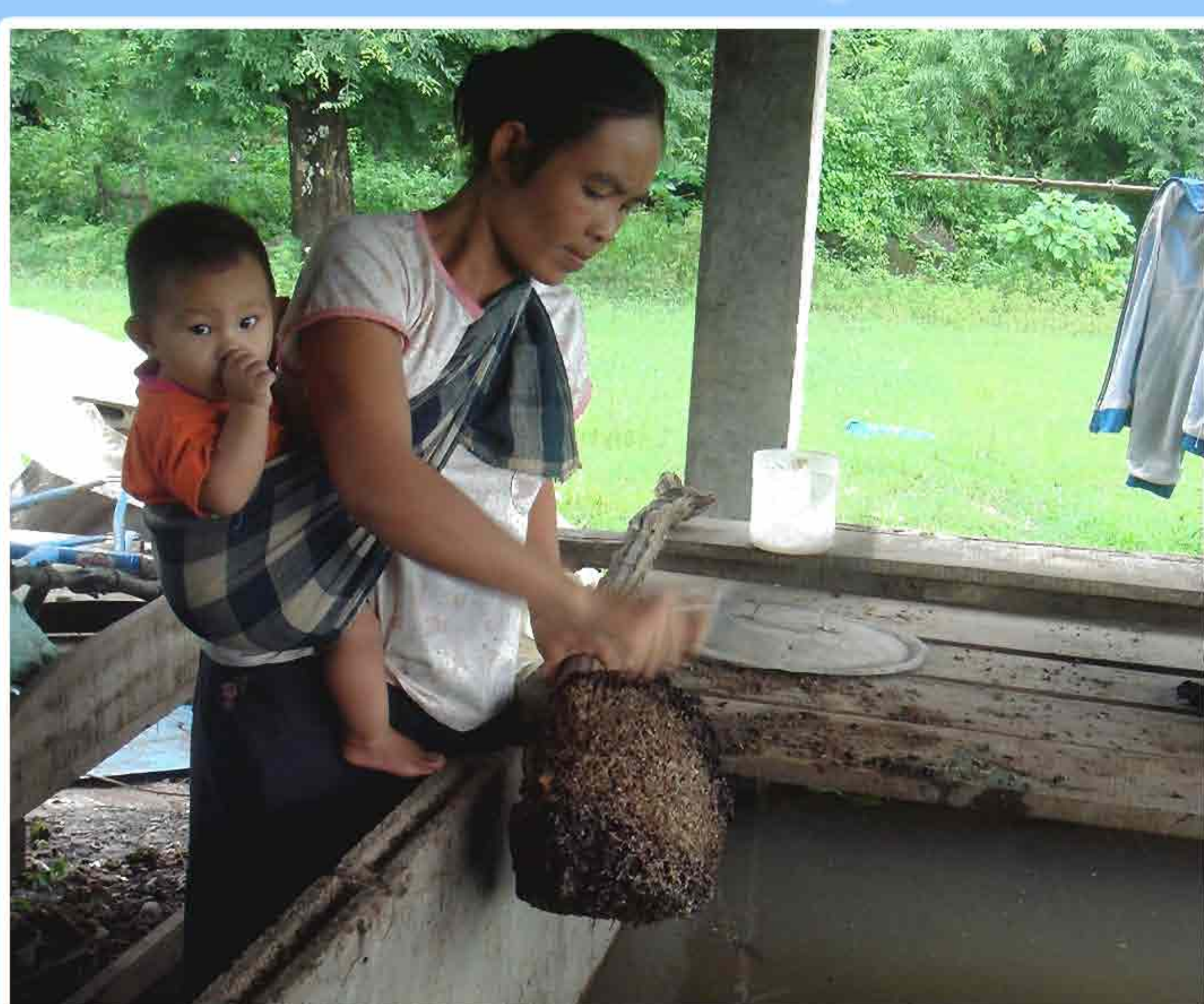
10. ການໃຫ້ອາຫານທຳມະຊາດ