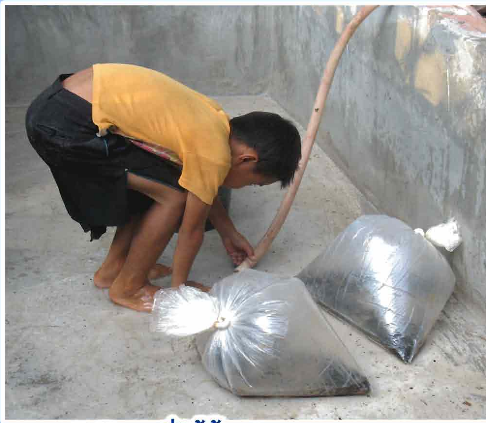
5. ການປ່ອຍນ້ຳໃໝ່ເຂົ້າກ່ອນປ່ອຍປາ