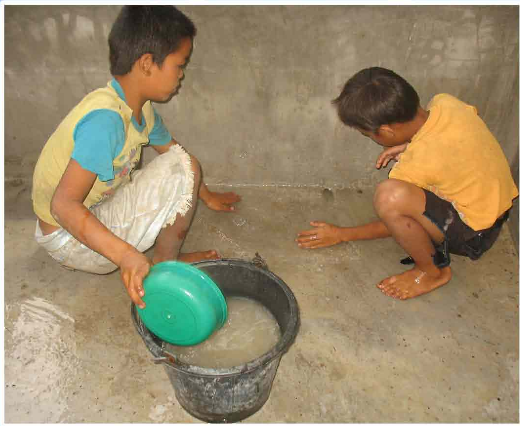
4. ການລ້າງນ້ຳປຸນອອກໃຫ້ໝົດກ່ອນລ້ຽງປາ