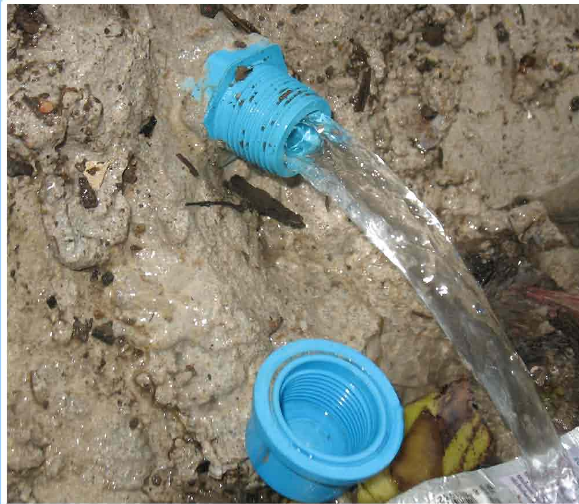
2. ທີ່ປ່ອຍນ້ຳອອກຈາກອ່າງຊີເມັນ