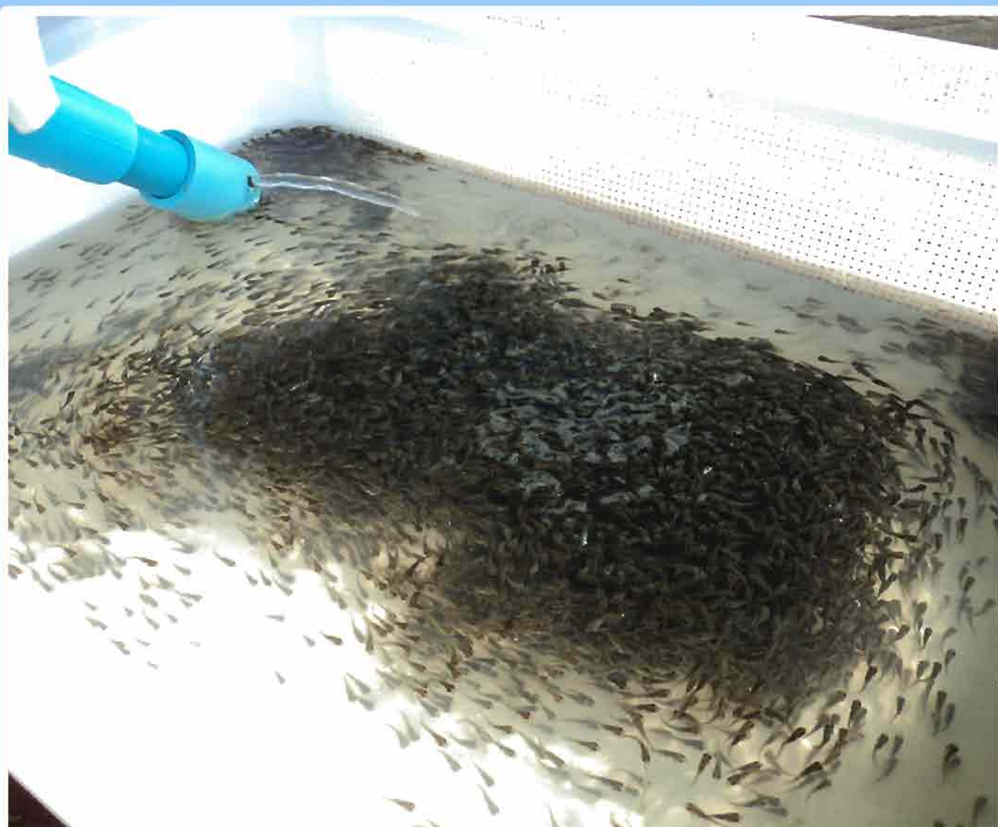
10. ການຟັກໄຂ່ປາໃນລະບົບຖາດ