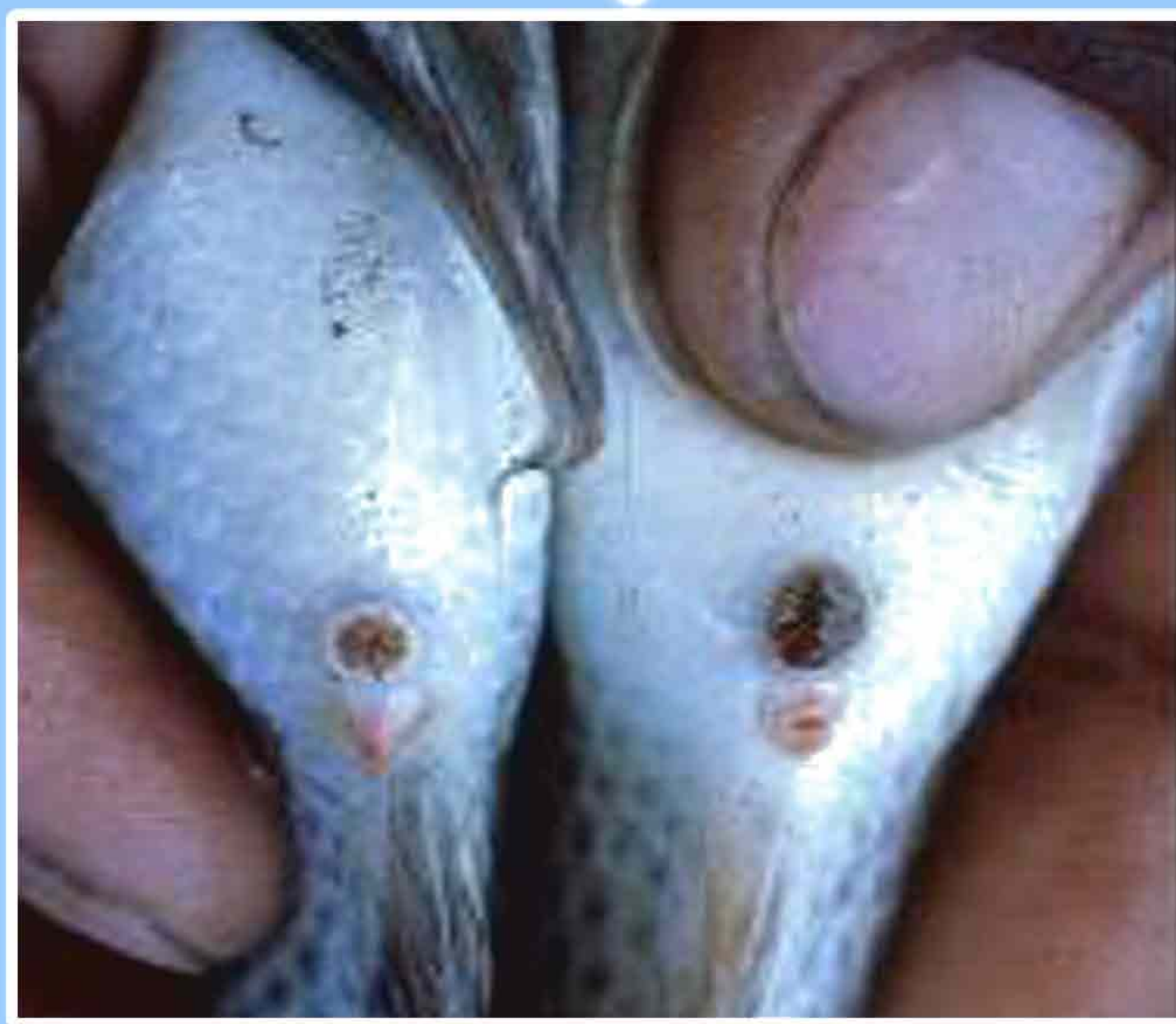
5. ລັກສະນະປາຕູ້ ແລະ ປາແມ່