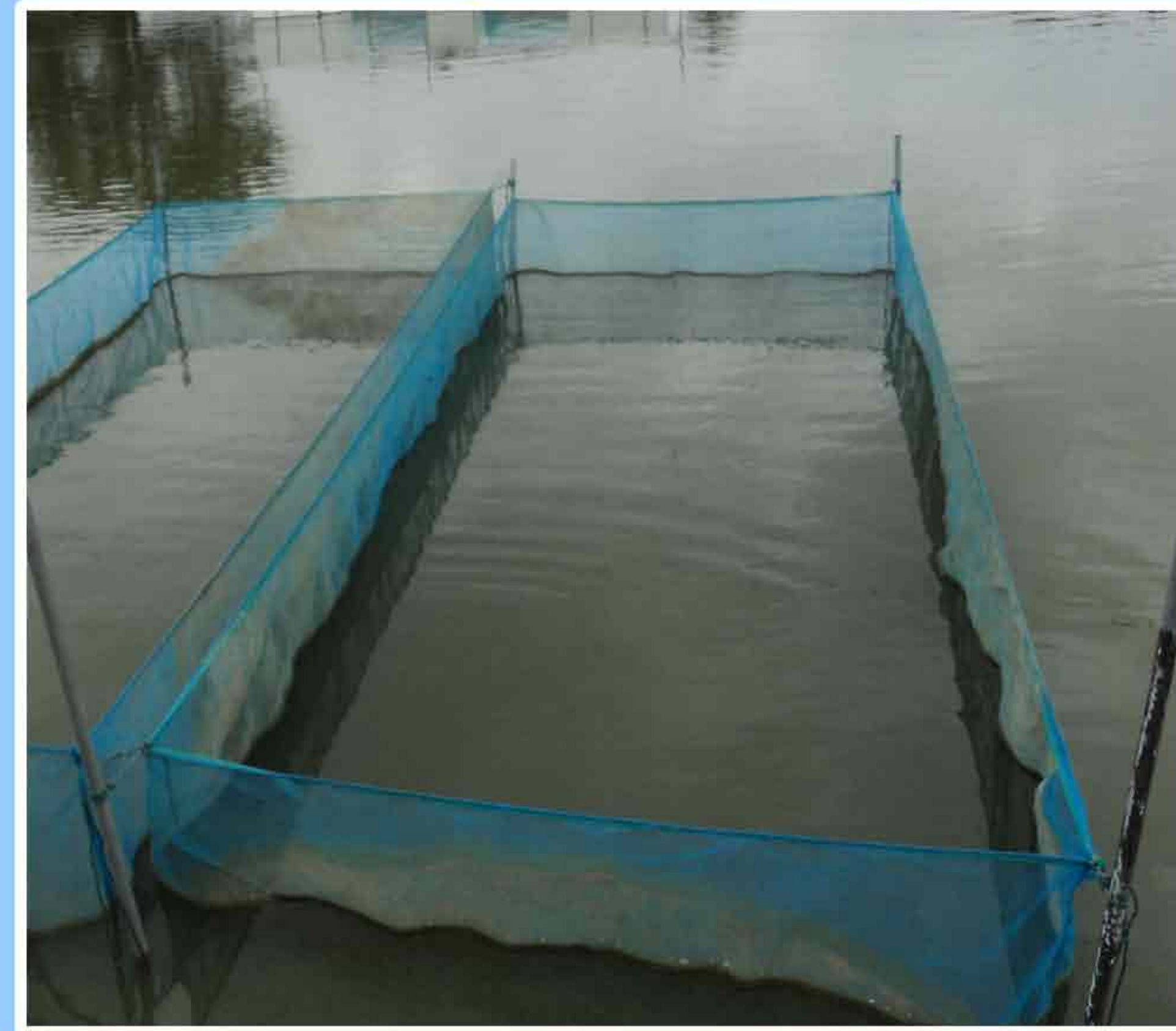
3. ການກະກຽມກະຊັງອະນຸບານລູກປາ