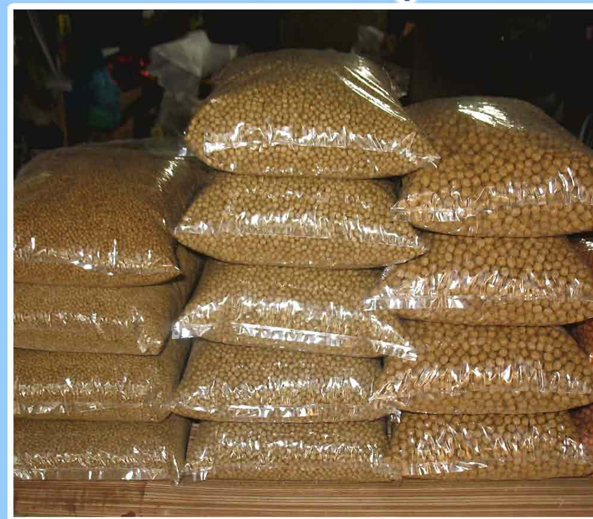
6. ອາຫານສຳເລັດຮູບ