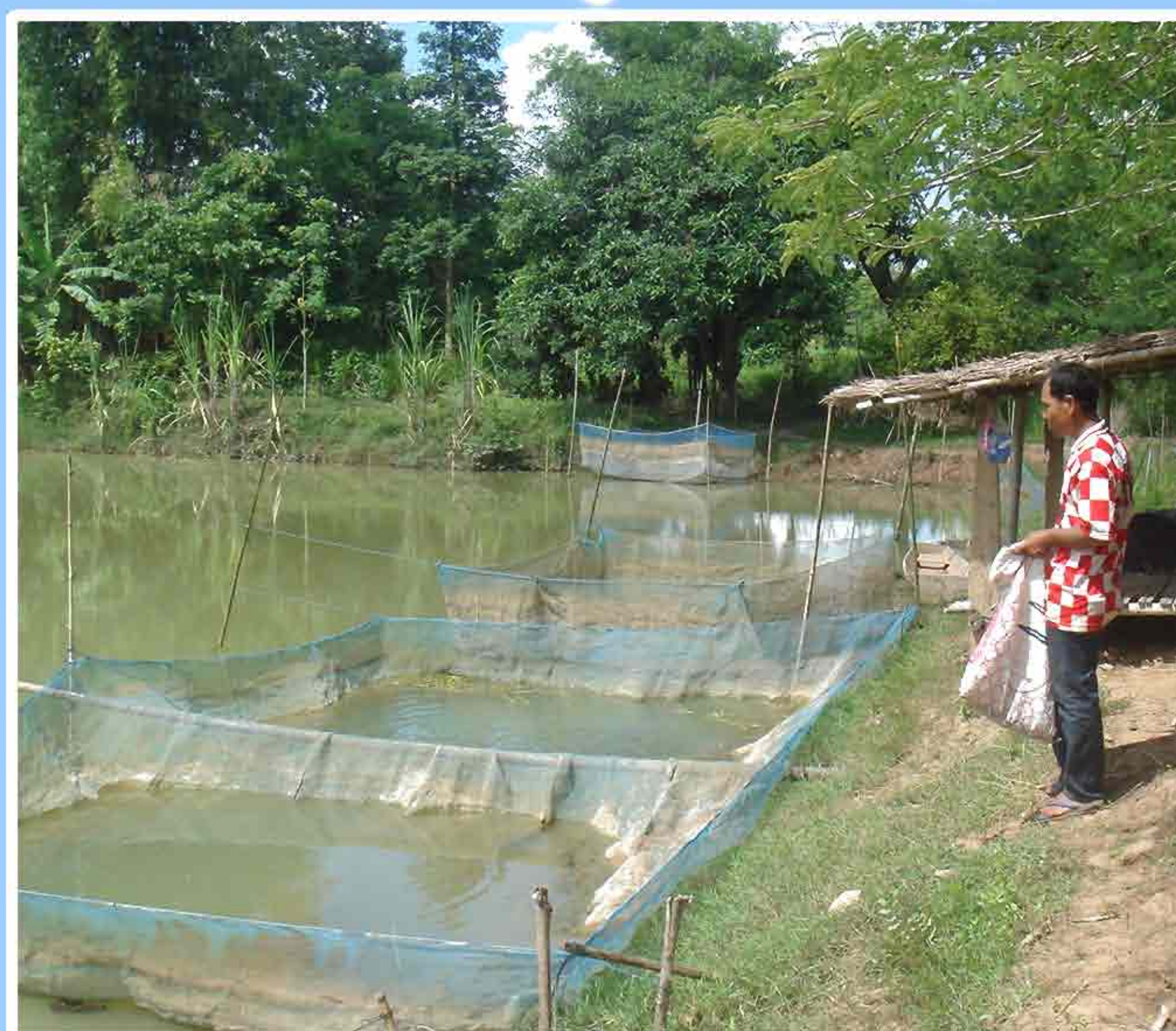
11. ການໃຫ້ອາຫານລູກປານິນໃນກະຊັງ