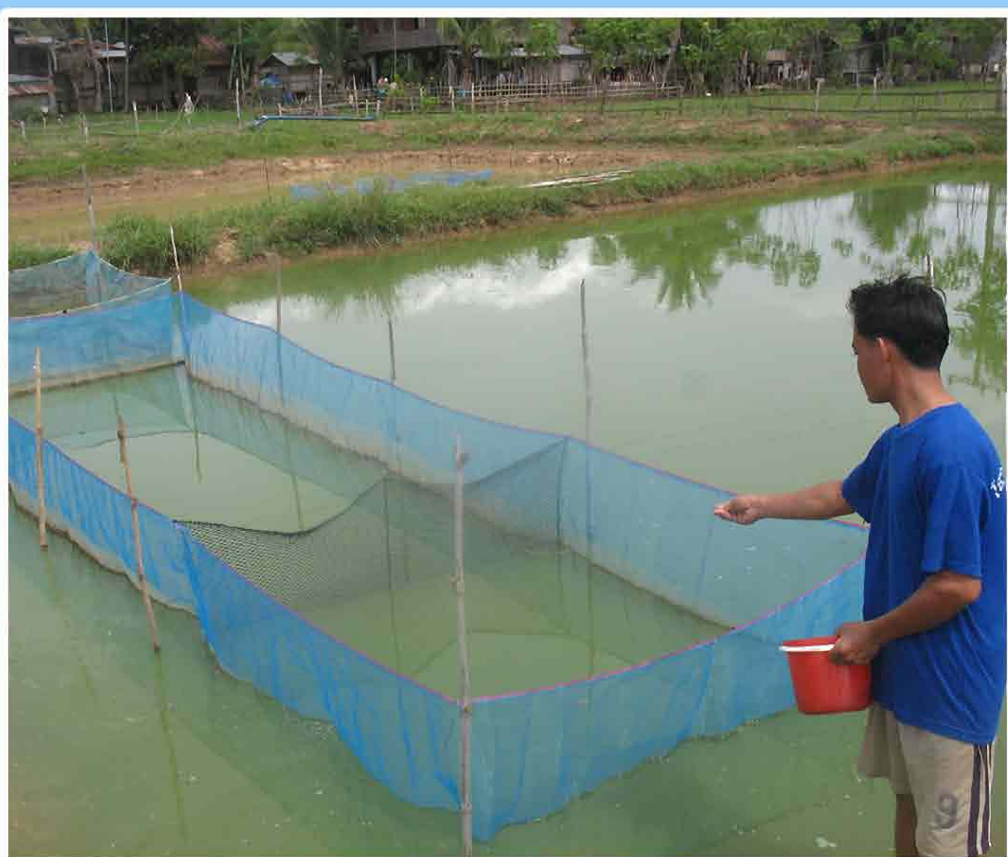
7. ການໃຫ້ອາຫານປາພໍ່ແມ່ພັນ