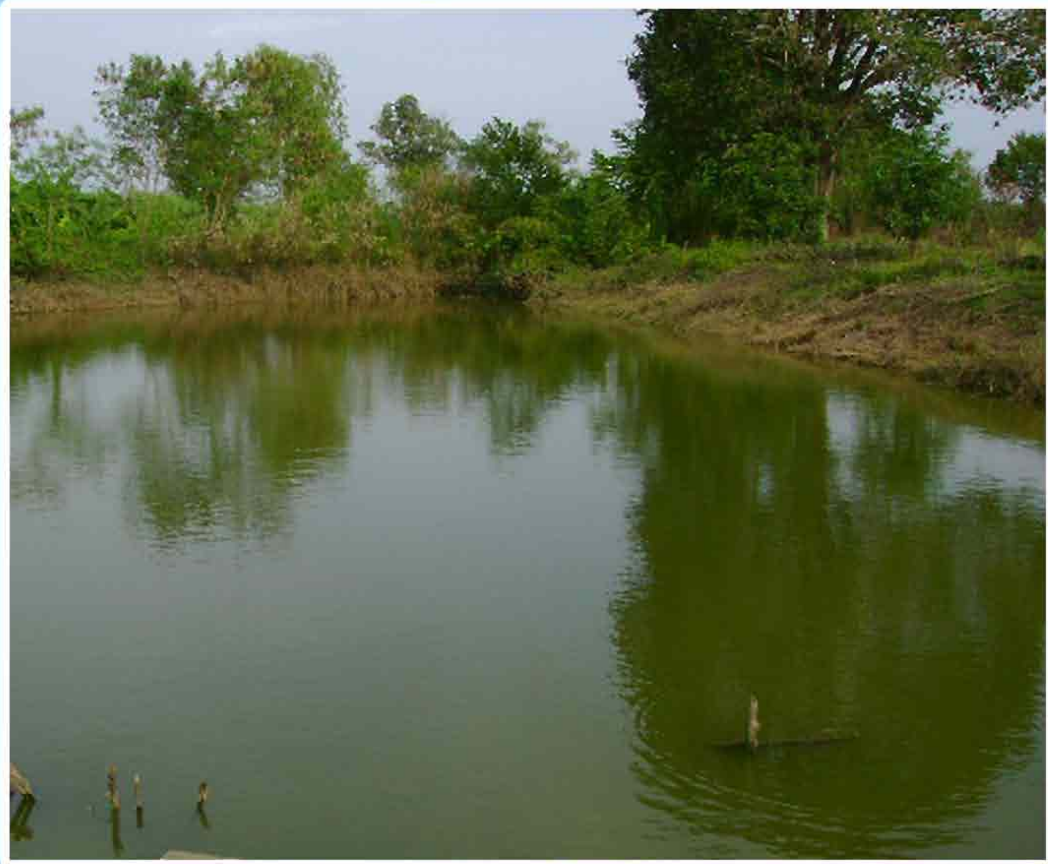
1. ການກະກຽມໜອງປະສົມພັນປາ