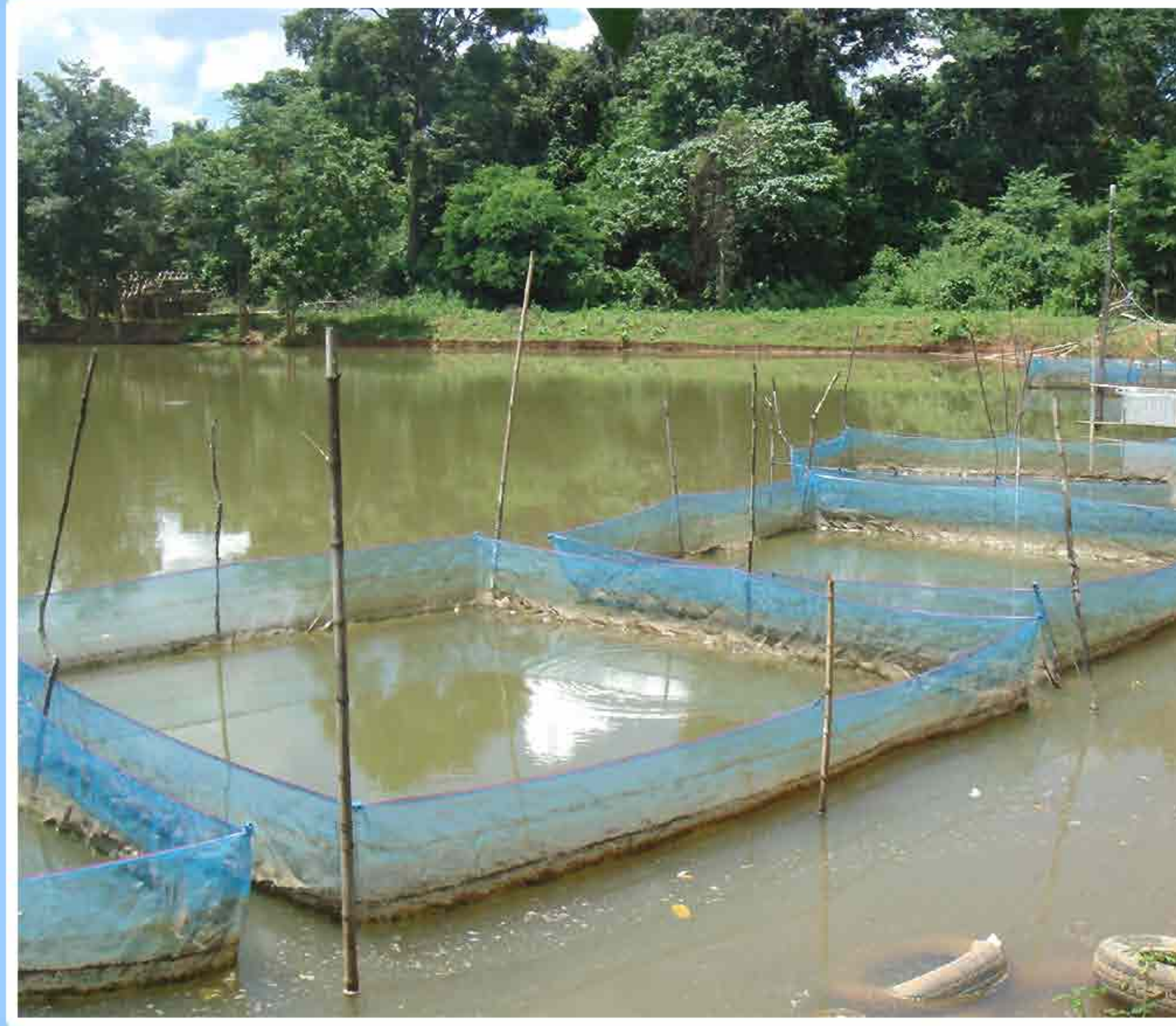
2. ການກະກຽມກະຊັງພໍ່ແມ່ພັນ