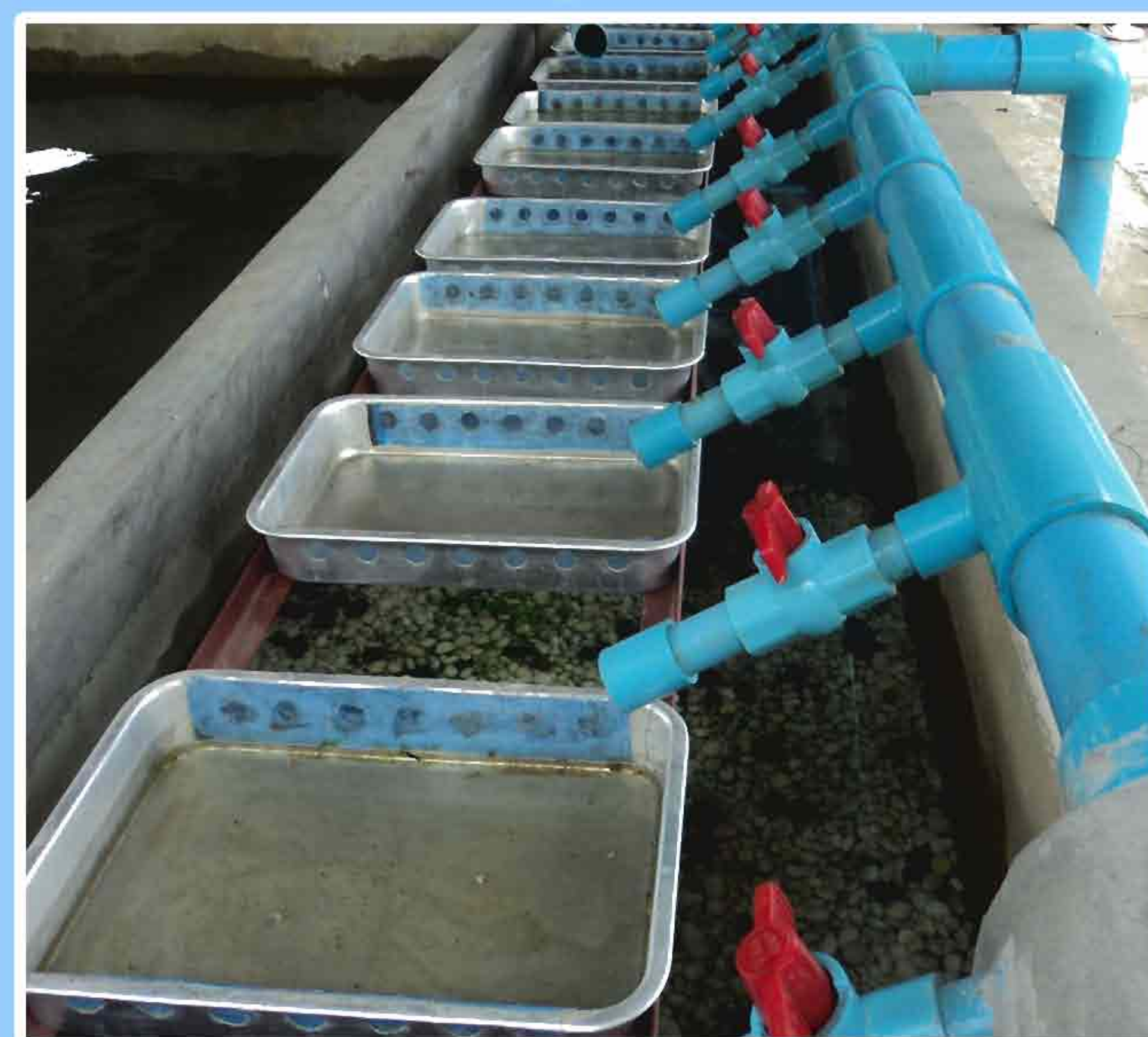
9. ລະບົບຖາດຟັກໄຂ່ປາ