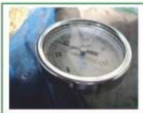
ອຸນຫະພູມບໍ່ໃຫ້ເກີນ 45 ອົງສາ