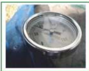
ອຸນຫະພູມບໍ່ໃຫ້ເກີນ 45 ອົງສາ