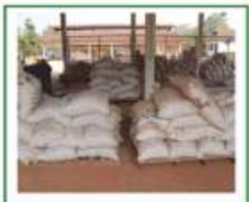
ໃຫ້ມີໄມ້ຂອງພື້ນວາງເປົ້າເຂົ້າ