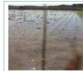
ປັກດຳເປັນແຖວ 20X20ຊມ