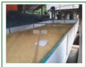
ອົບເຂົ້າໃນອຸນຫະພູມ 35-45 ອົງສາ