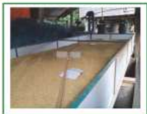
ອົບເຂົ້າໃນອຸນຫະພູມ 35-45 ອົງສາ