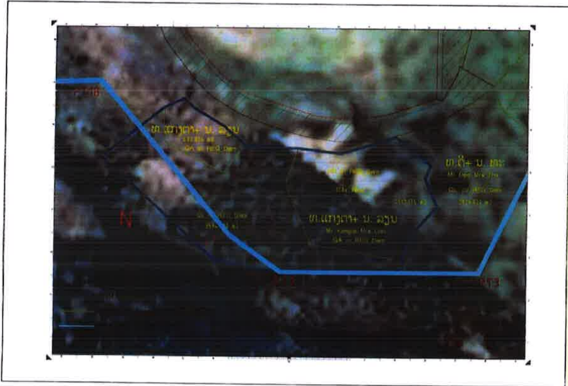
ມາດຕາສ່ວນ: 1/1000

ເນື້ອທີ່ດິນລວມ: 6,738.55 ມ 2 ເນື້ອທີ່ດິນສວນ: 3,144.55 ມ 2 ເນື້ອທີ່ປ່າເລົ່າ: 3594.00 ມ 2 ຂໍ້ຕົກລົງໄດ້ເຊັນສັນຍາກັນໃນຄັ້ງວັນທີ: 19/ 08 / 2014 ໂດຍ: